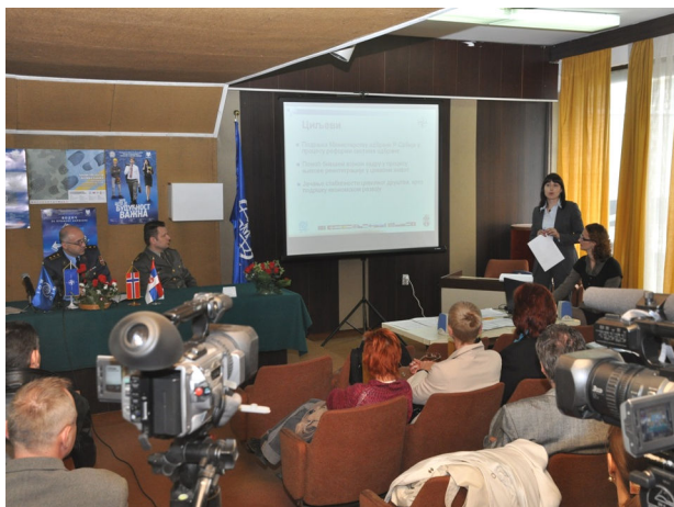
Канцеларија у Новом Саду, 14. април 2011.г.

NTF наставља да Министарству одбране Републике Србије континуирано преноси преостале активности пројекта