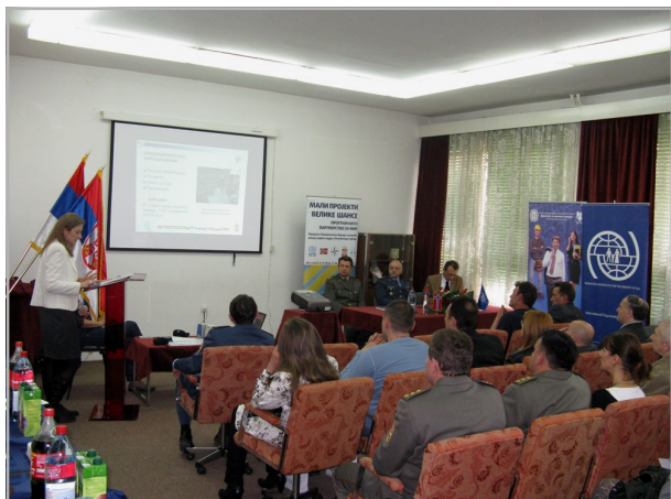
Канцеларија у Нишу, 20. април 2011.г.