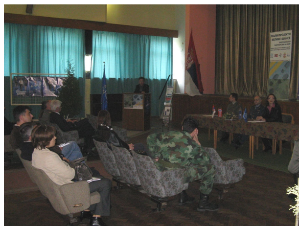
Канцеларија у Краљеву, 19. април 2011.г.

Сва три догађаја привукла су изузетну пажњу локалних медија.